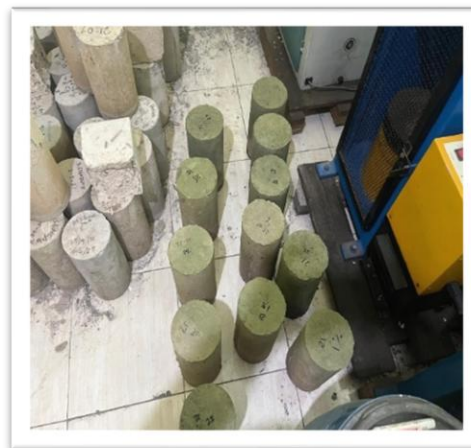
Gambar 1. Benda Uji

Tahapan analisis data dijalankan melalui kombinasi statistik deskriptif dan inferensial guna menarik simpulan ilmiah yang valid dan objektif. Peneliti mengolah data mentah mencakup perhitungan nilai rata-rata, simpangan baku, serta nilai ekstrem pada setiap kelompok umur pengujian. Perangkat lunak komputer digunakan untuk memproses angka-angka tersebut serta menghasilkan grafik regresi linier guna melihat tren perkembangan kekuatan secara visual. Analisis perbandingan dilakukan menggunakan uji statistik t-test untuk mendeteksi adanya perbedaan signifikan antara beton konvensional dengan beton pasir laut hasil intervensi kimia. Fokus evaluasi diarahkan pada pencapaian mutu rencana f'c 20 MPa sebagai standar kelayakan struktural. Rangkaian analisis statistik ini diproses secara teliti untuk membuktikan sejauh mana kombinasi pasir Batu Bintang dengan dosis aditif 2% mampu melampaui target kekuatan mekanis yang direncanakan. Langkah verifikasi akhir melibatkan pemeriksaan silang terhadap data berat dan gaya tekan guna menjamin hasil akhir penelitian dapat dipertanggungjawabkan secara akademik dalam praktik konstruksi sipil modern di masa depan secara tuntas.