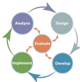
Gambar 1. Model Pengembangan ADDIE

Jenis penelitian ini menggunakan pendekatan Research and Development (R&D) dengan model pengembangan ADDIE. Model ADDIE terdiri atas lima tahap, yaitu analisis ( analysis ), perencanaan ( design ), pengembangan ( development ), implementasi ( implementation ), dan evaluasi ( evaluation ). Penelitian ini bertujuan menghasilkan media pembelajaran berbasis budaya Papua berupa permainan congklak bermotif Papua. Media yang dikembangkan diharapkan layak, praktis, dan efektif digunakan dalam pembelajaran tematik. Model ADDIE dipilih karena memberikan langkah pengembangan yang sistematis, di mana setiap tahap menjadi dasar penyempurnaan pada tahap berikutnya. Alur kelima tahap dalam model ADDIE yang digunakan pada penelitian ini dapat dilihat pada gambar 1 di bawah ini.