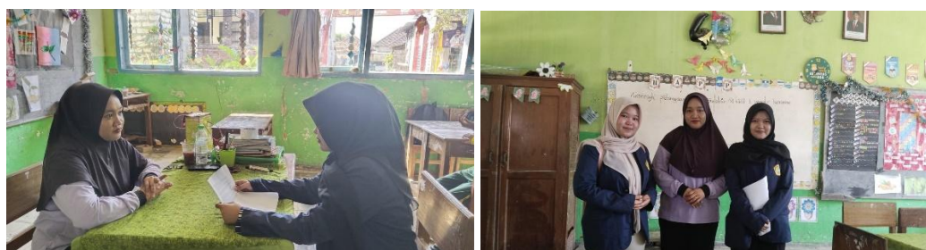
Gambar 1. Proses wawancara dengan guru kelas IV SDN Banyuajuh 5

Untuk memperoleh informasi yang lebih mendalam mengenai hambatan belajar tersebut, peneliti melakukan wawancara dengan guru kelas IV sebagai informan utama. Berdasarkan hasil wawancara, siswa juga mengalami kesulitan memahami materi pembelajaran. Guru menyampaikan bahwa siswa membutuhkan pengulangan materi agar dapat memahami pembelajaran yang diberikan, terutama pada materi matematika dasar seperti penjumlahan dan perkalian. Hal tersebut menyebabkan siswa mengalami kesulitan dalam menyelesaikan tugas maupun soal evaluasi yang diberikan guru. Proses pengumpulan data melalui wawancara dengan guru ditunjukkan pada Gambar 1.