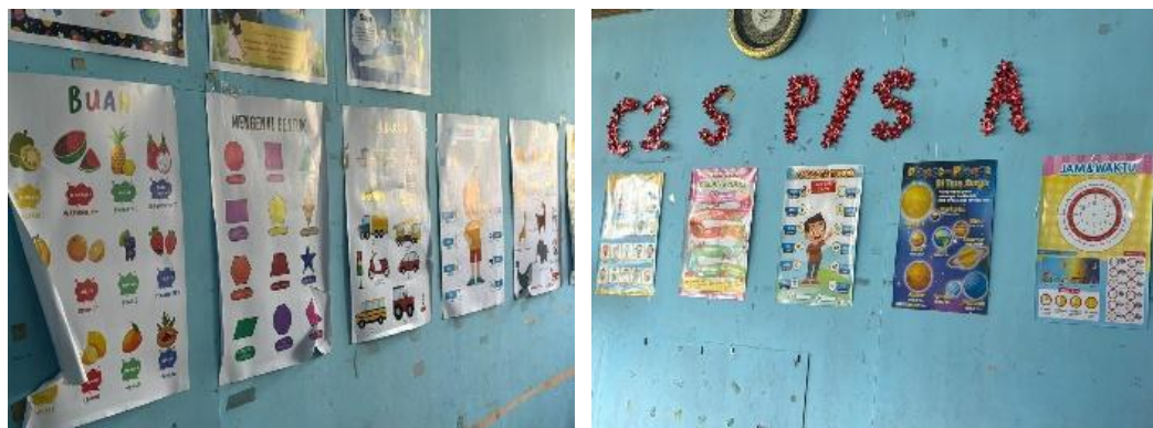
Gambar 2. Media gambar sederhana

Berdasarkan Gambar 1, terlihat bahwa guru melakukan adaptasi materi pembelajaran dengan menyesuaikan tingkat kemampuan peserta didik sehingga materi dapat diterima secara lebih optimal. Proses penyesuaian ini menunjukkan adanya upaya diferensiasi pembelajaran yang disesuaikan dengan karakteristik slow learner . Sementara itu, Gambar 2 menunjukkan penggunaan media gambar sederhana sebagai alat bantu visual dalam pembelajaran. Media tersebut membantu peserta didik dalam memahami materi secara lebih konkret, meningkatkan fokus belajar, serta mempermudah proses pengingatan konsep yang diajarkan. Dengan demikian, penggunaan penyesuaian materi dan media visual sederhana berkontribusi terhadap ketercapaian pembelajaran yang lebih efektif di kelas.