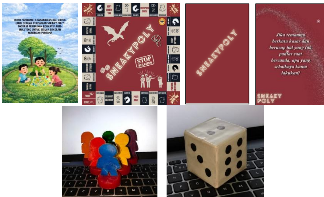
Gambar 2. Media sneaky poly Sebelum dan Sesudah Pengembangan

Berdasarkan gambar di atas, hasil pengembangan media menunjukkan bahwa permainan sneaky poly mengalami penyempurnaan yang cukup signifikan, baik pada muatan isi materi maupun komponen permainan. Pada desain awal, materi masih berfokus pada perilaku remaja di kawasan bantaran sungai berlahan basah dengan mengintegrasikan prinsip-prinsip Profil Pelajar Pancasila. Setelah melewati tahap validasi dan revisi, fokus tersebut dialihkan sepenuhnya agar selaras dengan tujuan penelitian, yakni menjadikan sneaky poly sebagai media pendukung layanan bimbingan klasikal dalam mencegah perilaku bullying pada siswa sekolah menengah pertama.