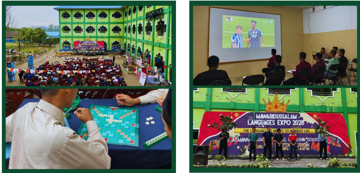
Gambar 1. Kegiatan Language Expo 2025 yang mengusung tema “The Languages Are Bridges To A Bright Life”

aktivitas keseharian yang secara sistematis mendorong santri untuk menggunakan bahasa Arab secara aktif dan berkelanjutan dalam kehidupan mereka di lingkungan pesantren.