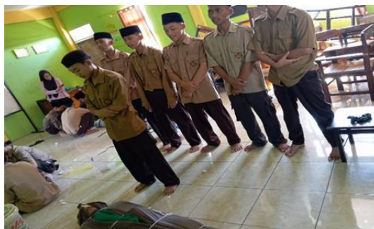
Gambar 4. Praktik Shalat Jenazah