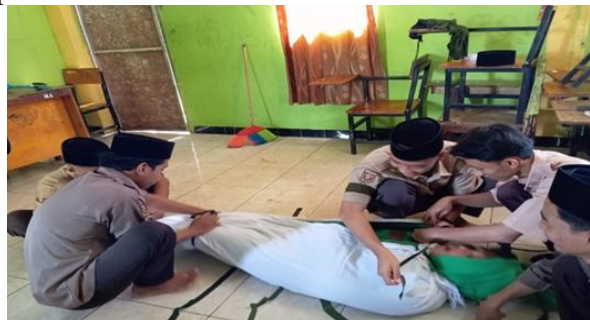
Gambar 3. Praktik Mengkafani Jenazah

Kegiatan ini melatih ketelitian peserta didik serta kerja sama antar anggota kelompok.