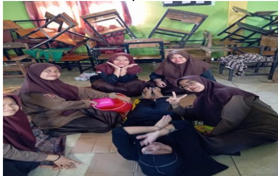
Gambar 2. Praktik Memandikan Jenazah

Melalui kegiatan ini, peserta didik belajar secara langsung mengenai urutan pelaksanaan serta sikap kehati-hatian dalam memperlakukan jenazah.