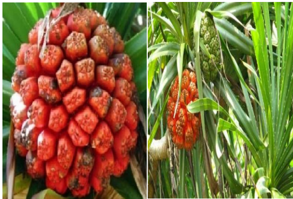
Gambar 3. Pandanus tectorius Parkinson (a,b dari Internet)