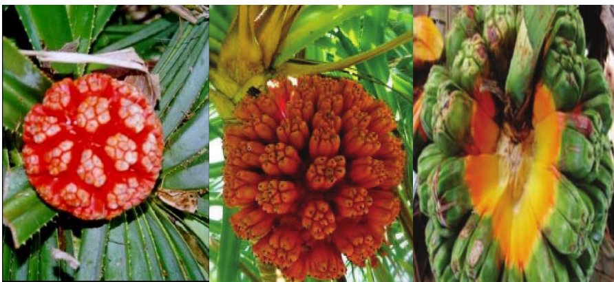
Gambar 2. Pandanus odoratissimus L.f. (a,b dari Internet)