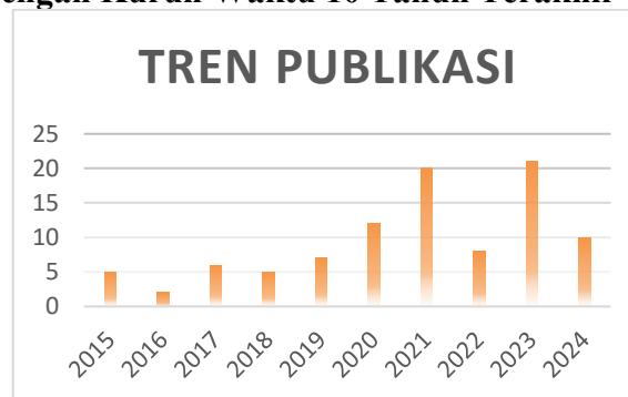
Gambar 1. Tren Publikasi dalam Kurun Waktu 10 Tahun Terakhir

Berdasarkan grafik publikasi diatas dapat dianalisis bahwa, pada tahun 2015-2024 terjadi perkembangan pada jumlah publikasi dengan perubahan yang signifikan, terjadi kenaikan dan penurunan pada setiap tahunnya. Tercatat sejumlah 5 artikel yang dipublikasi pada tahun 2015, dan terjadi penurunan pada tahun 2016 menjadi sejumlah 2 artikel yang dipublikasi. Pada tahun 2017-2019 terdapat peningkatan dan penurunan secara bertahap dari 6 menjadi 7 publikasi artikel. Terjadi sebuah peningkatan yang cukup pesat pada tahun 2020 sejumlah 12 publikasi artikel, namun pada tahun berikutnya yaitu tahun 2022 terjadi sebuah penurunan menjadi sejumlah 8 artikel yang dipublikasikan. Tahun 2023 menjadi puncak publikasi artikel terbanyak yaitu sejumlah 21 artikel yang dipublikasikan, namun pada tahun 2024 terjadi sebuah penurunan setengah dari jumlah publikasi artikel pada tahun sebelumnya, yaitu 10 artikel yang dipublikasikan. Dapat disimpulkan dari hasil analisis diatas, dimana terdapat peningkatan dan penurunan secara signifikan pada tahun 2015-2024 yang terjadi pada setiap tahunnya. Pada tahun 2015-2019 tidak banyak terjadi peningkatan artikel yang dipublikasikan, sedangkan peningkatan publikasi yang sangat pesat terjadi pada beberapa tahun terakhir yang dimulai pada tahun 2020, terutama puncaknya pada tahun 2023. Hal tersebut menunjukkan bahwa terjadi perkembangan dan peningkatan yang dipengaruhi oleh beberapa faktor seperti riset penelitian dan kondisi global setiap tahunnya.