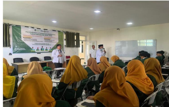
Gambar 1. Proses Penerapan Pendidikan Multimedia