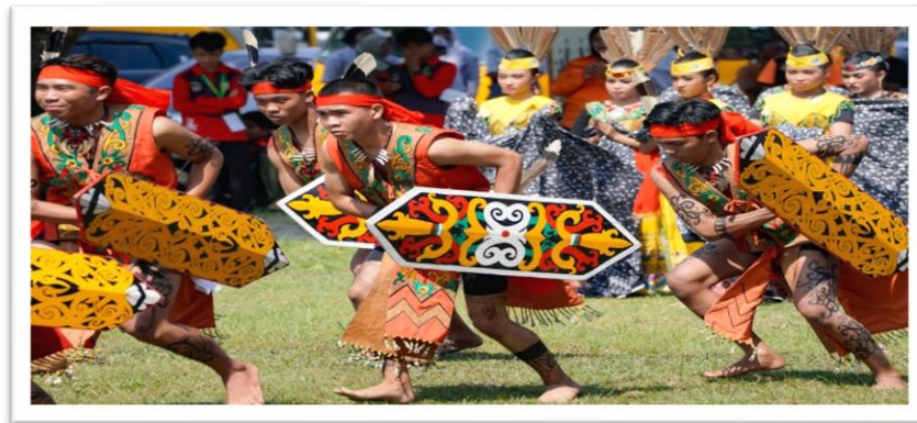
Gambar 3. Tari Mandau Talawang