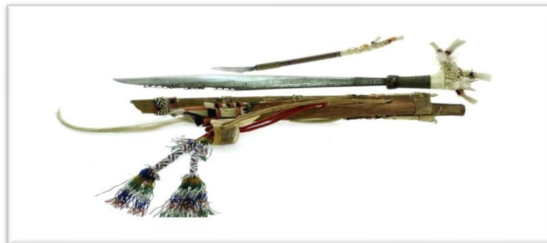
Gambar 2. Mandau