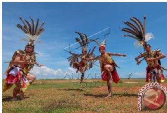
Gambar 1. Gerakan Kinyah