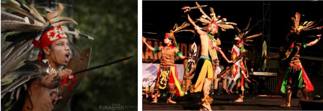
Gambar 4. Hiasan Bulu Burung Enggang