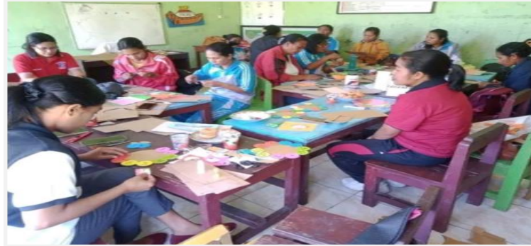
Gambar 1. Kegiatan KKG membuat media pembelajaran untuk menunjang proses perencanaan pembelajaran di TK St. Theresia Mangulewa

bersama yang lebih baik. Melalui penerapan solusi manajemen yang integratif ini, segala keterbatasan yang ada dapat diminimalisasi demi keberlanjutan pendidikan anak usia dini yang bermakna.