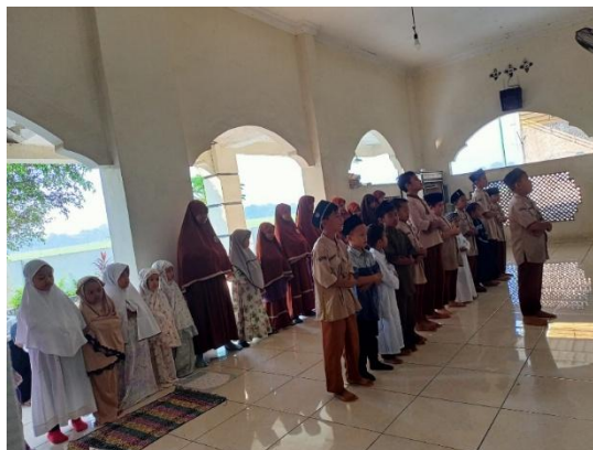
Gambar 1. Pelaksanaan Habituasi Shalat Dhuha Berjamaah pada Siswa SD

Selain catatan observasi dan wawancara, dokumentasi lapangan turut memberikan gambaran mengenai situasi pelaksanaan kegiatan. Visualisasi aktivitas siswa selama mengikuti shalat dhuha berjamaah disajikan pada Gambar 1 sebagai pelengkap informasi yang diperoleh melalui teknik pengumpulan data lainnya.