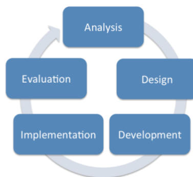
Gambar 1. Tahapan Model Pengembangan ADDIE

Tahap design dilakukan dengan menyusun rancangan media Papan Nilai Tempat (PANIPAT) yang memuat kolom satuan, puluhan, ratusan, ribuan, dan puluhan ribu serta dilengkapi kartu angka sebagai sarana manipulatif. Selanjutnya, tahap development dilakukan dengan membuat media menggunakan karton hardboard , mika bening, dan stik es krim agar media lebih aman, tahan lama, dan mudah digunakan dalam pembelajaran. Produk yang telah dikembangkan kemudian divalidasi oleh satu ahli materi dan satu ahli media dari Program Studi Pendidikan Guru Sekolah Dasar Universitas PGRI Semarang sebagai tahap validasi awal produk. Instrumen validasi menggunakan angket skala Likert yang mencakup aspek kesesuaian materi, tampilan media, kemudahan penggunaan, kebermanfaatan, serta kesesuaian media dengan karakteristik peserta didik sekolah dasar. Setelah melalui tahap revisi berdasarkan saran validator, media PANIPAT diimplementasikan pada pembelajaran materi nilai tempat untuk mengetahui tingkat kemenarikan, kemudahan penggunaan, dan respons pengguna terhadap media yang dikembangkan.