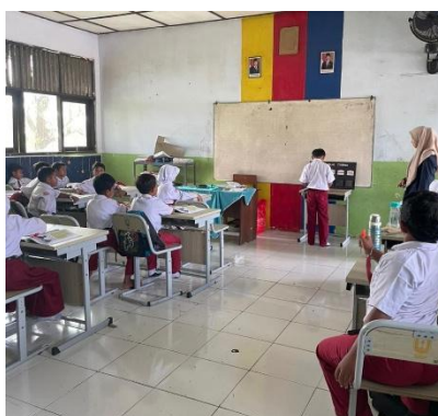
Gambar 3. Implementasi penggunaan media PANIPAT dalam pembelajaran

Berdasarkan Gambar 3, siswa terlihat lebih aktif dan antusias saat menggunakan media PANIPAT dalam pembelajaran. Hasil uji kepraktisan menunjukkan bahwa media PANIPAT memperoleh respons yang sangat baik dari guru maupun siswa. Hasil angket respons guru memperoleh skor 44 dari skor maksimal 50 dengan persentase sebesar 88% dan termasuk kategori “Sangat Baik”. Sementara itu, hasil angket respons siswa memperoleh skor 241 dari skor maksimal 250 dengan persentase sebesar 96,4% dan berada pada kategori “Sangat Baik”. Data tersebut menunjukkan bahwa media yang dikembangkan mudah digunakan, menarik perhatian siswa, serta membantu peserta didik memahami konsep posisi angka dengan lebih mudah. Ringkasan hasil respons guru dan siswa terhadap penggunaan media disajikan pada Tabel 2.