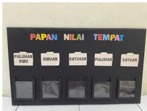
Gambar 2. Media PANIPAT hasil pengembangan

Pengembangan PANIPAT dilakukan menggunakan model ADDIE yang terdiri atas tahap analysis , design , development , implementation , dan evaluation . Tahap analysis dilakukan dengan mengidentifikasi kebutuhan guru dan siswa terhadap media pembelajaran konkret, sedangkan tahap design dilaksanakan dengan merancang papan nilai tempat yang dilengkapi kartu angka manipulatif. Selanjutnya, pada tahap development media dibuat menggunakan karton hardboard , stik es krim, dan mika bening agar aman serta tahan lama digunakan dalam pembelajaran. Produk yang telah selesai dikembangkan kemudian divalidasi oleh ahli materi dan ahli media sebelum diimplementasikan dalam pembelajaran matematika. Hasil pengembangan media PANIPAT dapat dilihat pada Gambar 2.