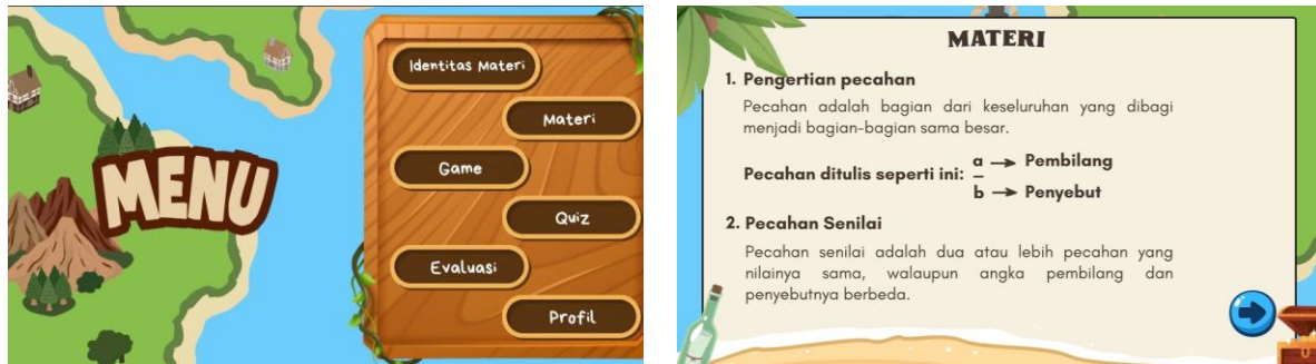
Gambar 1. Media Pembelajaran Petcha