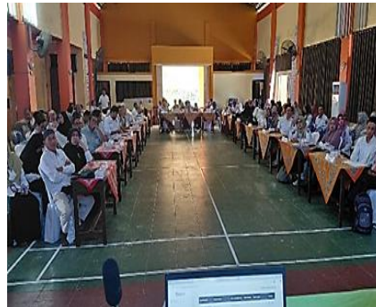
Gambar 2. Rapat Pleno

Gambar 2 Dokumentasi kegiatan rapat pleno yang dilaksanakan di SMK Negeri 3 Mataram sebagai bagian dari proses perencanaan dan koordinasi program sekolah. Kegiatan ini melibatkan kepala sekolah, wakil kepala sekolah, serta seluruh guru dan tenaga kependidikan dalam membahas program kerja dan evaluasi pelaksanaan layanan pendidikan. Rapat pleno menjadi wadah untuk menyampaikan kebijakan, membagi tugas, serta menyelaraskan pelaksanaan layanan khusus baik akademik maupun non-akademik. Melalui kegiatan ini, diharapkan seluruh program yang direncanakan dapat berjalan secara terarah, terkoordinasi, dan sesuai dengan tujuan peningkatan mutu pendidikan di sekolah. Namun demikian, terdapat beberapa faktor penghambat yang memengaruhi optimalisasi layanan. Salah satu kendala utama adalah keterbatasan fleksibilitas anggaran, di mana “RKAS yang sudah direncanakan terlalu kaku sehingga kebutuhan mendadak sulit diakomodasi” (KS). Selain itu, keterbatasan sumber daya manusia, khususnya kurangnya tenaga ahli atau pelatih profesional, juga menjadi hambatan, sebagaimana diungkapkan bahwa “guru yang ditugaskan belum tentu memiliki keahlian khusus di bidang tersebut” (WKS). Beban tugas ganda guru serta keterbatasan penyesuaian sarana prasarana turut memengaruhi efektivitas pelaksanaan layanan.