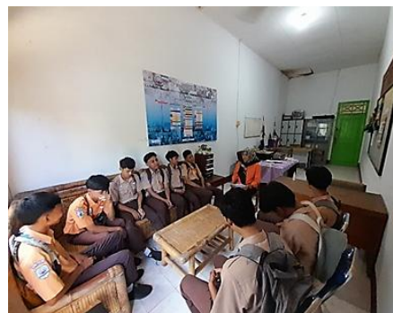
Gambar 5. Konseling Kelompok

Gambar 4. Dokumentasi pelaksanaan home visit (kunjungan rumah) yang dilakukan oleh pihak sekolah sebagai bagian dari layanan bimbingan dan konseling. Kegiatan ini bertujuan untuk menjalin komunikasi dengan orang tua atau wali peserta didik serta memahami kondisi lingkungan tempat tinggal siswa secara langsung. Melalui home visit, sekolah dapat mengidentifikasi faktor-faktor eksternal yang memengaruhi perkembangan akademik dan non-akademik siswa. Selain itu, kegiatan ini juga menjadi sarana kolaborasi antara sekolah dan keluarga dalam memberikan pendampingan yang lebih optimal kepada peserta didik.