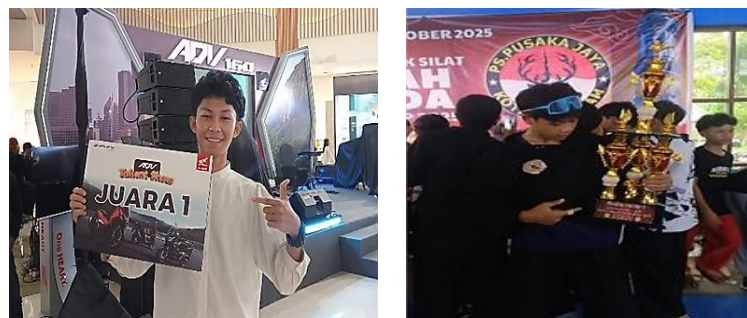
Gambar 1. Seni Colorguard & Juara Pencak Silat

implementasi layanan khusus memberikan dampak positif terhadap peningkatan kemampuan akademik dan non-akademik peserta didik. Hal ini ditunjukkan melalui capaian prestasi siswa di tingkat nasional maupun daerah, serta meningkatnya keteraturan proses pembelajaran dan partisipasi siswa dalam kegiatan ekstrakurikuler. Layanan yang terstruktur dan didukung fasilitas memadai turut menciptakan lingkungan belajar yang kondusif serta mendorong perkembangan keterampilan kognitif, sosial, dan emosional siswa secara seimbang. Sebagai bentuk konkret dari keberhasilan layanan pengembangan minat dan bakat, siswa SMK Negeri 3 Mataram menunjukkan berbagai capaian prestasi di bidang seni dan olahraga. Prestasi tersebut merupakan hasil dari pembinaan ekstrakurikuler yang dilakukan secara terencana dan berkelanjutan oleh sekolah, sebagaimana ditunjukkan pada Gambar 1.