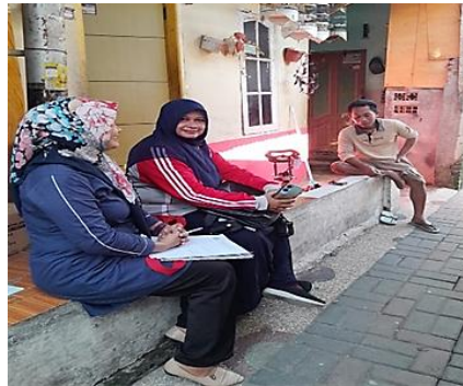
Gambar 4. Home Visit

prosedur penanganan siswa secara berjenjang, mulai dari wali kelas hingga kepala sekolah (WKS). Sebagai bagian dari implementasi layanan bimbingan dan konseling, sekolah tidak hanya memberikan pendampingan di lingkungan sekolah, tetapi juga melakukan pendekatan secara langsung kepada peserta didik melalui berbagai layanan yang bersifat preventif dan kuratif. Layanan tersebut bertujuan untuk memahami kondisi siswa secara menyeluruh serta membantu mengatasi permasalahan akademik maupun sosial, sebagaimana ditunjukkan pada Gambar 4 dan Gambar 5.