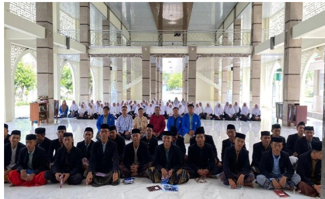
Gambar 2. Sosialisasi Penguatan Identitas Kemuhammadiyah di MI Muhammadiyah 1 Tanjungrejo