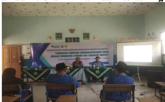
Gambar 1. Sosialisasi literasi dan teknologi digital di MI Muhammadiyah 1 Tanjungrejo