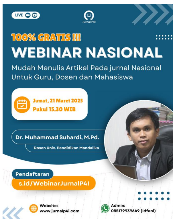
Gambar 1. Poster Kegiatan Webinar Nasional

Metode pelaksanaan kegiatan pengabdian masyarakat ini berfokus pada pendekatan daring yang komprehensif, memanfaatkan teknologi untuk efisiensi dan jangkauan luas. Tahap awal melibatkan koordinasi intensif melalui grup WhatsApp dengan tim pelaksana, memastikan setiap anggota memahami peran dan tanggung jawabnya. Narasumber bekerja sama dengan Tim Jurnal P4I selaku instansi pengundang dalam kegiatan ini. Diskusi ini mencakup penentuan jadwal webinar, penyusunan materi presentasi, dan pembagian tugas teknis secara detail. Diskusi juga membahas potensi kendala yang mungkin muncul dan menyiapkan langkah-langkah antisipasi untuk menjamin kelancaran acara. Seluruh proses persiapan ini didikoordinasikan dengan baik untuk referensi pelaksanaan kegiatan berikutnya di masa mendatang.