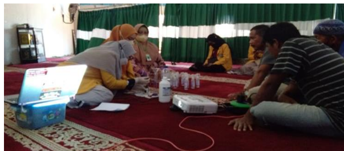
Gambar 3. Pembuatan produk linen spray