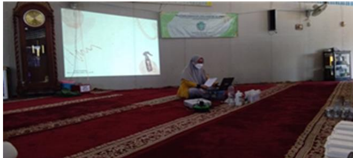
Gambar 2. Pemutaran video pembuatan linen spray

Peserta pengabdian masyarakat kali ini tidak masyarakat keseluruhan, tetapi 15 kader pengurus masjid Manarap Hal ini disebabkan karena pelaksanaan pengabdian dengan menerapkan protokol kesehatan yang tidak diperbolehkan adanya kerumunan sehingga dengan membatasi peserta, juga pelaksana pengabdian. Selain itu, sebentar lagi masjid Manarap dipergunakan untuk sholat taraweh dan kegiatan ramadhan lainnya, sehingga linen sanitizer ini sangat diperlukan.