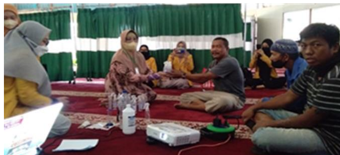
Gambar 4. Penyerahan produk linen spray