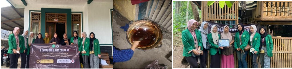
Gambar 2. Dokumentasi Kegiatan Pengabdian (wawancara, pelatihan, dan proses produksi gula aren)

Gambar 2 menunjukkan bahwa kegiatan dilaksanakan secara langsung di lingkungan usaha mitra dengan melibatkan peserta secara aktif dalam setiap tahapan. Interaksi antara tim pelaksana dan peserta terlihat dalam proses penyampaian materi hingga praktik langsung. Dokumentasi ini menggambarkan bahwa pendekatan yang digunakan bersifat partisipatif dan kontekstual. Hal tersebut mendukung terciptanya proses pembelajaran yang lebih aplikatif bagi peserta.