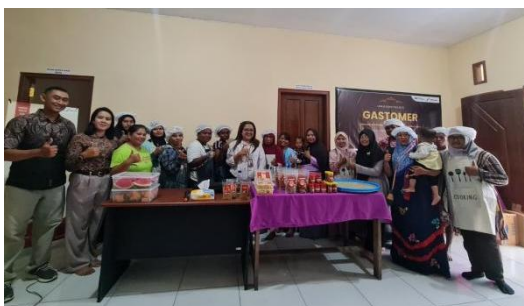
Gambar 3 Produk jadi GASTOMER