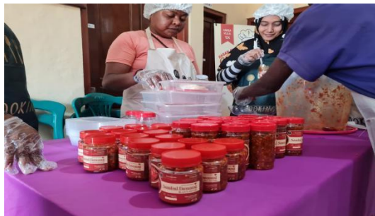
Gambar 4 Pengemasan GASTOMER

Hasil kegiatan menunjukkan bahwa masyarakat mampu menghasilkan berbagai produk olahan berbasis ikan gastor yang memiliki potensi untuk dikembangkan sebagai produk UMKM lokal. Produk yang dihasilkan dalam kegiatan ini disajikan pada Tabel 4.