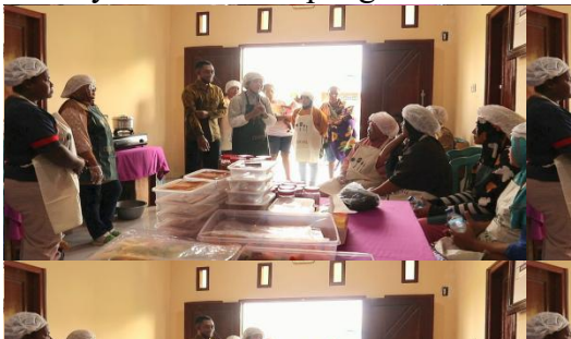
Gambar 1 Sosialisasi GASTOMER

Pelaksanaan program GASTOMER (Ragam Olahan Ikan Gastor Merauke) memberikan hasil yang signifikan terhadap peningkatan keterampilan masyarakat dalam pemanfaatan potensi sumber daya perikanan lokal. Kegiatan ini menunjukkan adanya peningkatan partisipasi masyarakat dalam kegiatan pelatihan serta meningkatnya kemampuan masyarakat dalam mengolah ikan gastor menjadi produk bernilai ekonomi. Berikut gambar kegiatan pengabdian kepada masyarakat di Kampung Buti Merauke.