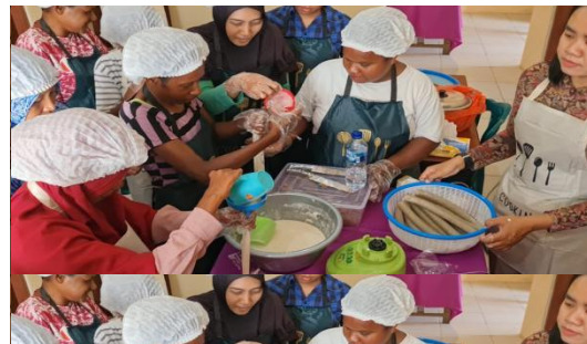
Gambar 2 Produktivitas GASTOMER