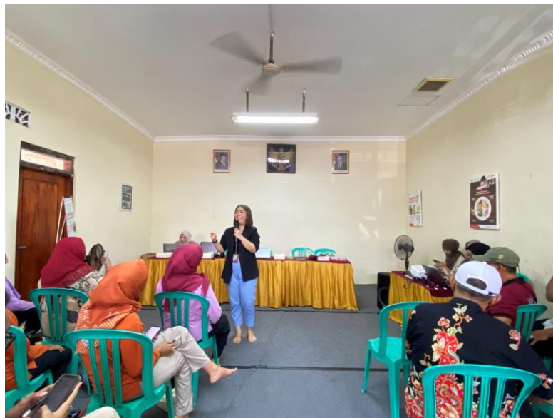
Gambar 1. Penyampaian Materi I dan 2

Sesi terakhir pada hari pertama diisi dengan materi konseling dasar yang mencakup teknik dasar konseling, membangun rapport , mendengarkan secara aktif, serta komunikasi empatik. Selain penyampaian materi, sesi ini juga dilengkapi dengan praktik langsung oleh peserta. Kegiatan ini bertujuan agar peserta tidak hanya memahami konsep dasar konseling, tetapi juga memiliki keterampilan awal dalam membangun hubungan yang aman dan suportif dengan klien.