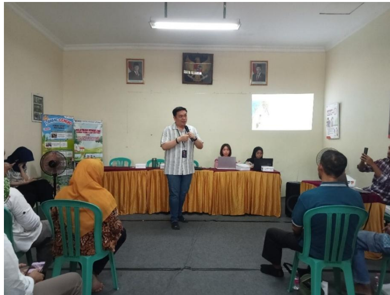
Gambar 3. Penyampaian Materi 4

Setelah penyampaian materi, peserta melakukan praktik konseling secara berpasangan dengan mensimulasikan peran sebagai korban dan konselor secara bergantian. Sesi selanjutnya difokuskan pada penyusunan komitmen bersama untuk mengimplementasikan hasil pelatihan dalam proses pendampingan korban KDRT oleh kader JPPA Kelurahan Tanjungmas. Kegiatan pelatihan ditutup dengan pelaksanaan evaluasi.