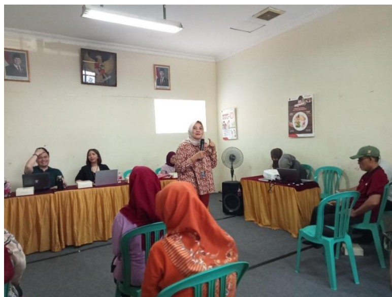
Gambar 2. Penyampaian Materi 3

Sesi terakhir pada hari pertama diisi dengan materi konseling dasar yang mencakup teknik dasar konseling, membangun rapport , mendengarkan secara aktif, serta komunikasi empatik. Selain penyampaian materi, sesi ini juga dilengkapi dengan praktik langsung oleh peserta. Kegiatan ini bertujuan agar peserta tidak hanya memahami konsep dasar konseling, tetapi juga memiliki keterampilan awal dalam membangun hubungan yang aman dan suportif dengan klien.