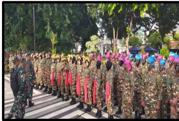
Gambar 1. Efisiensi Administrasi Personel

Keberhasilan pengawasan dalam sistem manajemen pertahanan modern ini tidak lepas dari kemampuan infrastruktur digital untuk mengolah ribuan titik data secara simultan. Pemanfaatan sistem informasi manajemen tidak hanya terbatas pada pencatatan kehadiran saja melainkan juga mencakup pemantauan kondisi kesehatan setiap personel secara berkala. Dengan adanya data kesehatan yang terintegrasi, tim medis dapat memberikan respon cepat terhadap gejala penyakit yang mungkin timbul selama masa pelatihan berlangsung di lapangan. Hal ini sangat krusial mengingat intensitas latihan fisik yang tinggi memerlukan standar kebugaran yang sangat optimal bagi setiap peserta Komponen Cadangan. Selain itu, kecepatan akses informasi memudahkan pimpinan untuk mengambil keputusan strategis yang didasarkan pada realitas objektif di unit pendidikan militer. Digitalisasi administrasi ini telah mengubah cara kerja tradisional yang lambat menjadi lebih dinamis dan akuntabel sesuai dengan tuntutan zaman modern. Pada akhirnya, inovasi sistem ini memperkuat struktur birokrasi internal dan memastikan bahwa seluruh sumber daya manusia dapat dikelola dengan standar profesionalisme yang maksimal.