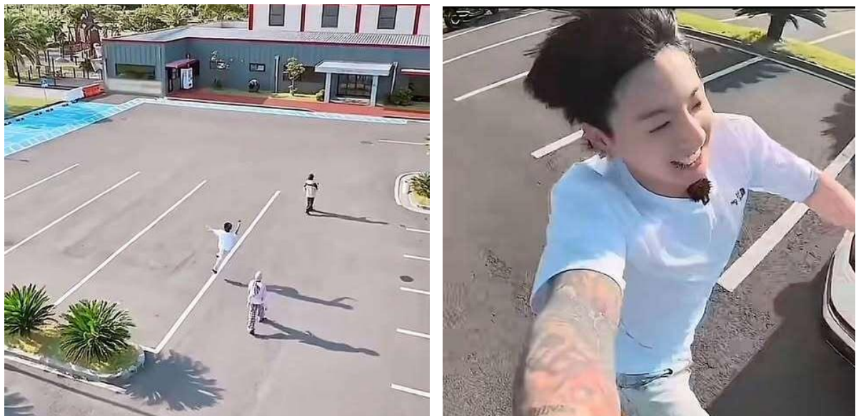
Gambar 3. Screenshot Momen Lucu JK Berlari

Temuan ini menunjukkan bahwa proses decoding pesan humor bersifat terbuka dan dapat dinegosiasikan oleh penonton. Narasumber menyatakan bahwa humor membuat interaksi antar pemain terlihat lebih akrab, hangat, dan nyaman untuk dilihat. “Humor bikin interaksi mereka keliatan lebih dekat dan nyaman. Jadi kita ngeliatnya bukan cuma acara jalan-jalan, tapi hubungan kekeluargaan antar mereka” (Silpy, 2025). Pemaknaan ini menunjukkan bahwa humor berfungsi dalam pembentukan makna sosial serta memperkuat kedekatan emosional antara pemain dan penonton. Salah satu adegan yang paling dianggap merepresentasikan pengalaman pribadi narasumber adalah momen ketika Jungkook berlari kecil dengan tingkah lucu saat hendak makan bersama Jimin dan V (Kim Taehyung). Adegan ini dinilai sangat relate dengan kehidupan sehari-hari narasumber. “Btw episode ini yang aku suka banget karena literally ini gue banget 🥰, berasa ngaca 🥰” (Silpy, 2025). Adegan yang dimaksud dapat dilihat pada Gambar 3 berikut.