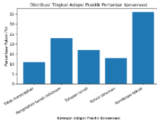
Gambar 1. Distribusi Tingkat Adopsi Praktik Pertanian Konservasi

Berdasarkan visualisasi pada Gambar 1, kategori penerapan kombinasi beberapa teknik konservasi memiliki proporsi paling besar dibandingkan dengan kategori lainnya. Hal ini menunjukkan bahwa sebagian petani telah mengintegrasikan beberapa teknik konservasi dalam satu sistem budidaya. Sementara itu, jumlah petani yang belum menerapkan praktik konservasi terlihat lebih kecil dibandingkan dengan kelompok petani yang telah mengadopsinya. Visualisasi ini membantu memperjelas distribusi tingkat adopsi praktik konservasi di kalangan petani responden.