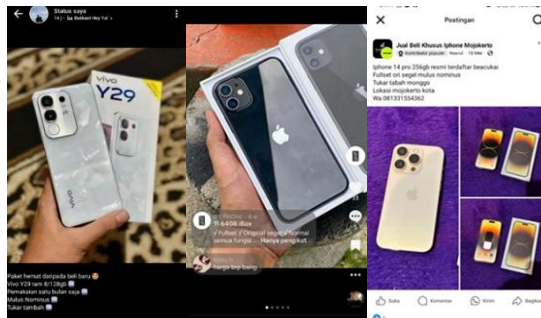
Gambar 3. Promosi penjualan handphone

Seperti yang terlihat pada gambar 3, promosi usaha terekam melalui unggahan di WhatsApp, TikTok, dan Facebook, menunjukkan konsistensi pemilik usaha dalam pemasaran daring. Foto aktivitas penjualan dan transaksi menandakan adanya hubungan komunikasi yang baik. Bukti-bukti ini memperkuat strategi pemasaran digital dan mendorong terciptanya loyalitas pelanggan.